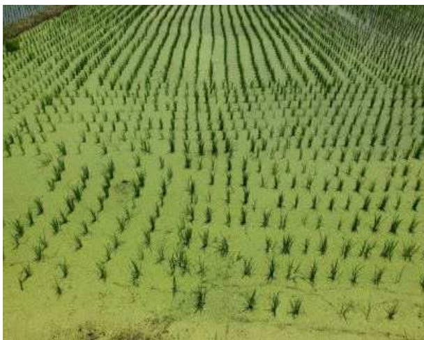
녹조 발생 논