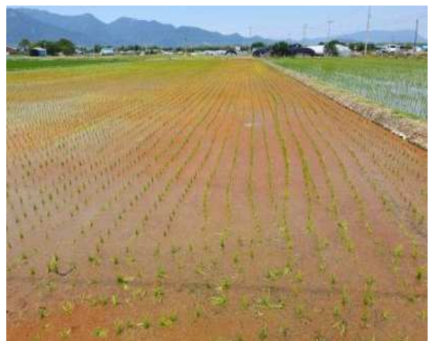
홍조 발생 논