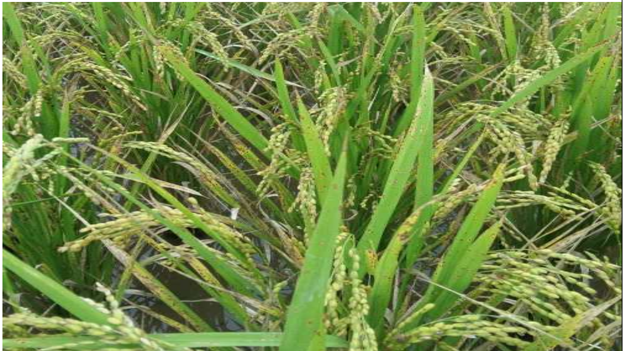
깨씨무늬병 발병 논